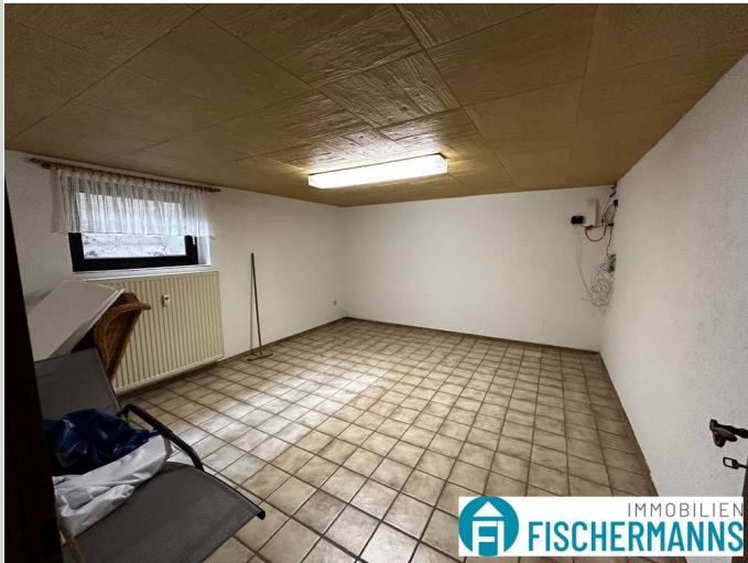
2. Zimmer im Keller

Zimmer: 4,00 Wohnfläche ca.: 129,00 m 2 Kaufpreis: 340.000,00 EUR