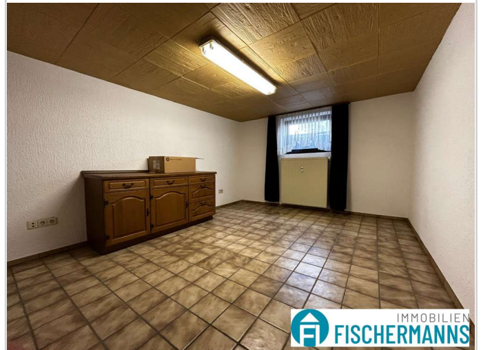
1. Zimmer im Keller