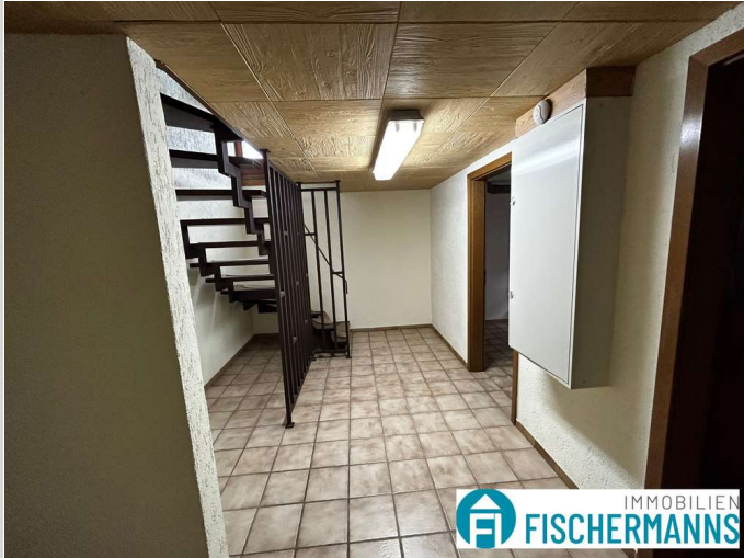
Flur im Keller

Zimmer: 4,00 Wohnfläche ca.: 129,00 m 2 Kaufpreis: 340.000,00 EUR