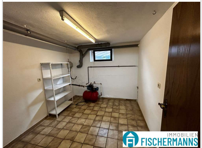
Abstellraum im Keller